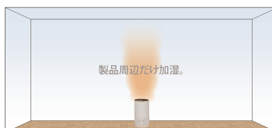
【一般的なスチーム加湿器】